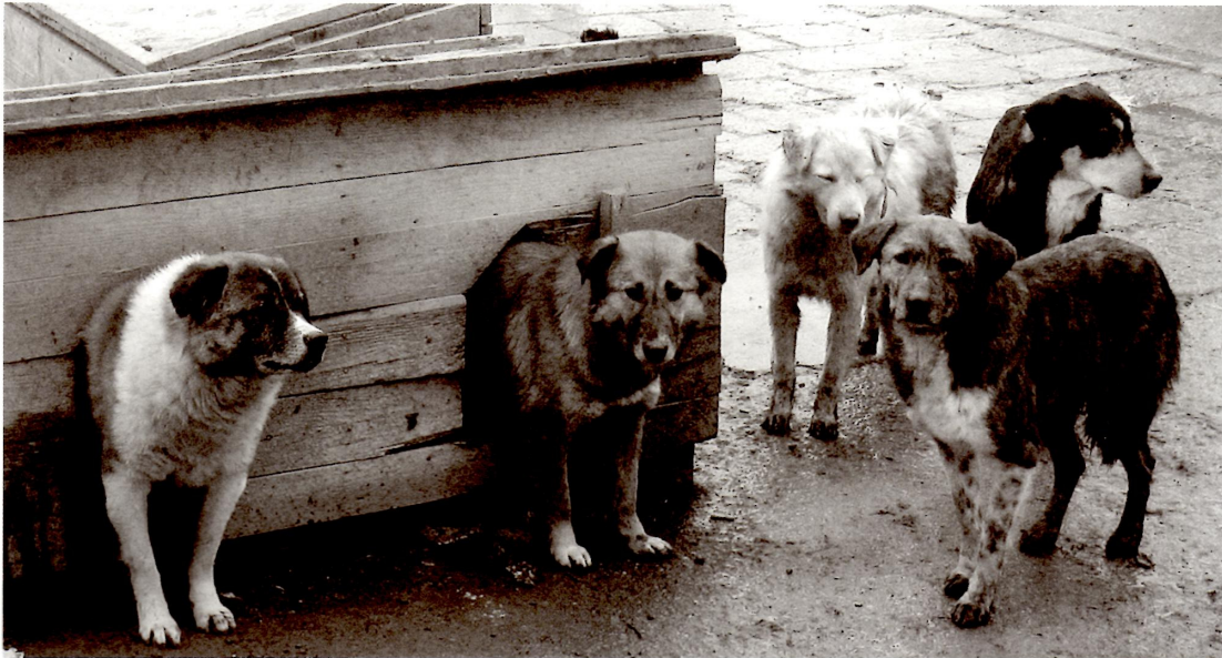
Mocht u een hond uit Mr. Cenacs asiel willen adopteren, neemt u dan alstublieft contact op met Stichting Orfa, www.dierenhulpofa.nl

Omdat WereldAsielen zelf geen plaatsingen doet, zullen de adopties worden verzorgd door Stichting Orfa . Deze stichting heeft ruime ervaring met het plaatsen van Roemeense honden. We maken graag gebruik van hun expertise en zijn hen bijzonder dankbaar voor hun hulp.