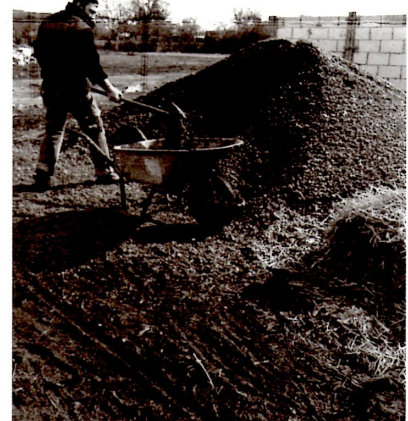
De overlast door de gesmolten sneeuw wordt verholpen door de berg gravel. De honden zitten er dus weer droog bij in Moreni.

de winter niet lang aan en begon de temperatuur in februari weer op te lopen. De sneeuw begon te smelten, waardoor er een nieuw probleem ontstond. Alle kennels kwamen onder water te staan en de opvang werd één grote modderpoel. Anca heeft toen besloten gravel te laten bezorgen, zodat de honden weer droog kwamen te staan. En daar waren ze heel blij mee, zoals u kunt zien op de foto!