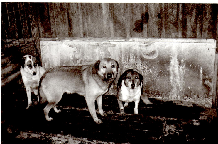
Honden die het in de grote roedel niet redden, zitten apart. Ook deze drie wat timide dieren hopen we zo snel mogelijk daar weg te kunnen halen.

Toen dit alles klaar was, konden de eerste honden komen. We kozen bij dit transport bewust voor de dieren die er het slechtst aan toe waren. Zoals Beer en Wolf, twee honden die in de grote roedel geen kans kregen om genoeg eten te bemachtigen. Ook een hondje dat acuut medische hulp nodig had, mocht meekomen. Dit dier is inmiddels met succes geopereerd en wordt liefdevol verzorgd op een opvangadres.