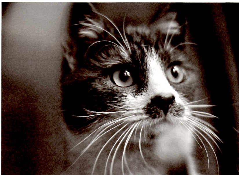
Deze schoonheid was een tijdje geleden nog een zwerver, maar werd gered door de stichting van Agnieszka. Hij is onlangs geplaatst bij een adoptiegezin.