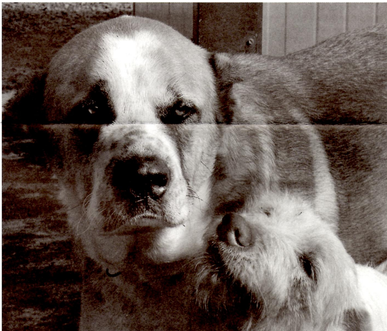
Ook de honden in het asiel namen afscheid van hun grote vriend

was iedereen in Malagón verrukt met de adoptie en daarmee de kans op een normaal leven voor deze lieve slungel; tegelijkertijd moesten de vrijwilligers toegeven dat ze deze bijzondere hond heel erg zullen missen. Vanaf de eerste dag had hij een warm plekje in het hart van velen.