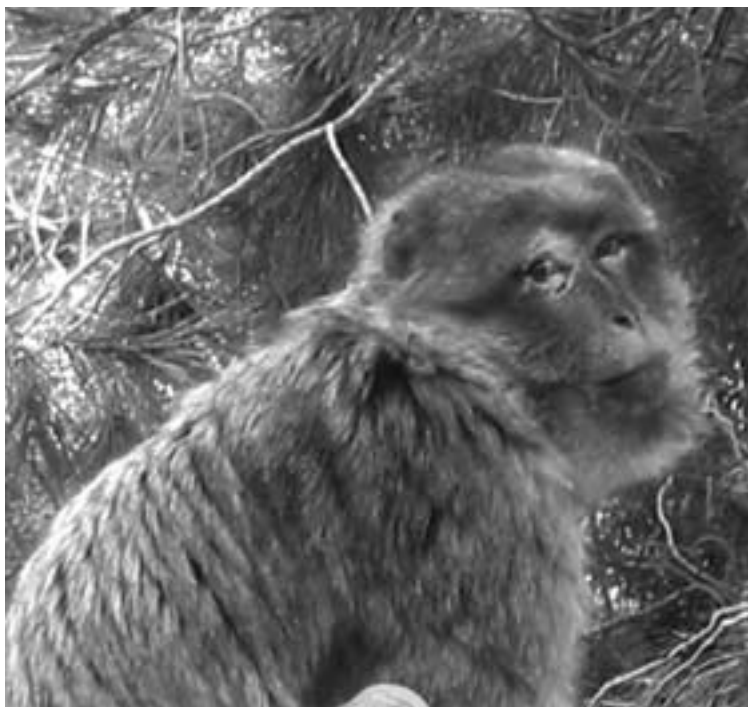
Nepal na zijn ontsnapping weer veilig terug op zijn honk.

dat de politie hem dan zou afschieten. Dit was wel het laatste dat deze jongen verdiende. De politie kon ook niet helpen zoeken want zij hadden het