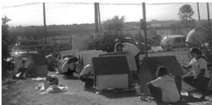
Een aantal vrijwilligers kwam helpen met het bouwen van hondenhokken.

Het was hard nodig om de buitenrennen aan te pakken, want de bodem werd almaar drassiger. Op de foto's is te zien dat alle rennen overkapt worden met zeildoek, zodat de dieren nu droog zitten. Voor warmte hoeft er in dit Zuid-Amerikaanse land niet te worden gezorgd. Dat scheelt weer geld. Ook zijn er tientallen hondenhokken getimmerd, geschilderd en afgewerkt, zodat de dieren op ieder moment de schaduw kunnen opzoeken. Het klinkt tegenstrijdig, maar in Uruguay hebben zwerfdieren het juist slecht door de 'dierenwet', waar het woord dier nauwelijks in voorkomt. Hierdoor