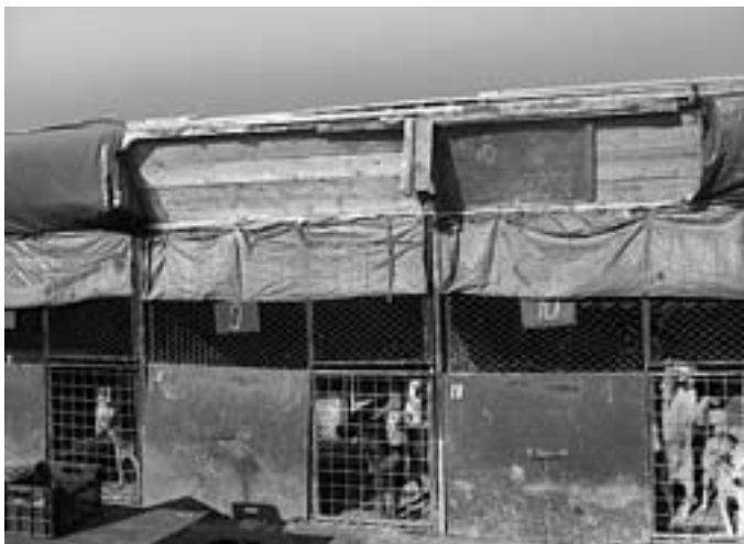
De dieren zijn ondergebracht in een voormalige pelsdierenfokkerij. Bij extreme kou en sneeuwstormen gaan de zeilen naar beneden.