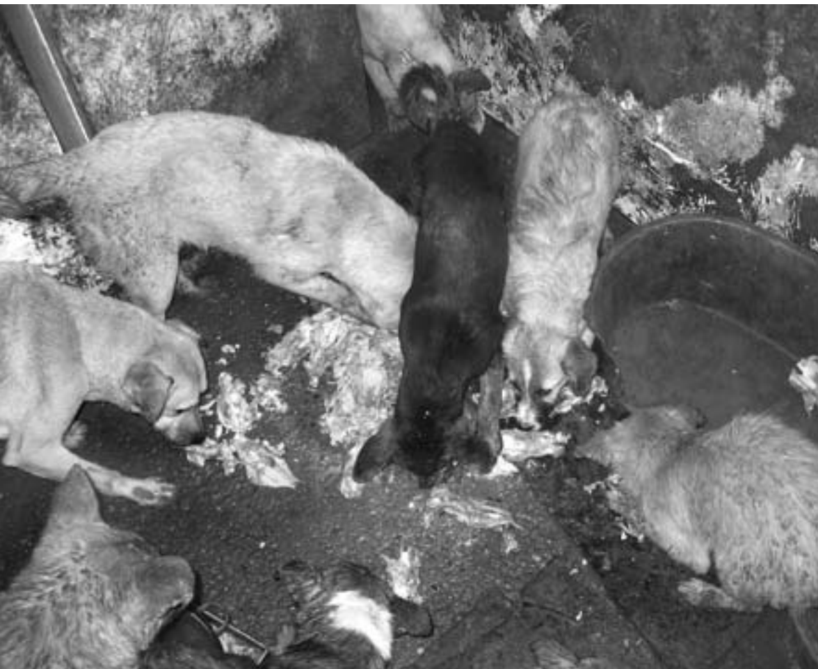
Het eten bestaat voornamelijk uit gekocht slachtafval en door gebrek aan water is het erg vies in het asiel.

Omdat Roemenië zo corrupt is, maakt WereldAsielen niet rechtstreeks geld over naar dit land, maar naar Romania Animal Rescue