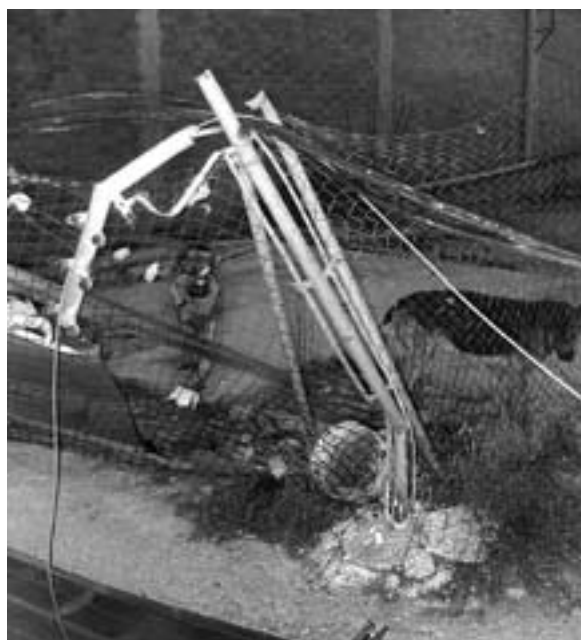
Omdat er nog spanning op de kabels stond, durfde niemand de honden te helpen.

In het weekend van de storm namen de zware windstoten ook veel elektriciteitskabels mee. Een aantal van die losgerukte kabels kwam terecht op het fabrieksterrein bij de honden. Omdat er nog spanning op stond, durfde niemand de dieren daar weg te halen want dat was levensgevaarlijk. Men moest dus wachten op de brandweer. Maar die had het ook te druk dus liepen de honden al die tijd gevaar geëlektrocuteerd te worden. Schijnbaar realiseerden alleen de asielmedewerkers en de mensen van WereldAsielen zich dit, want niemand liep een stap harder om te helpen. Opnieuw volgden er dus angstige uren. Maar ook in dit geval kwam er uiteindelijk goed nieuws. De honden waren