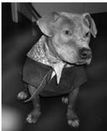
Hier ziet u Gigi in een dress van Chanel. Het materiaal bestaat uit groene crêpe en de bijpassende shawl is van Chinese zijde.