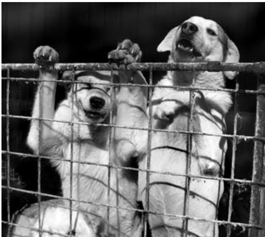
Twee Roemeentjes bedelend om een aai over hun bol.