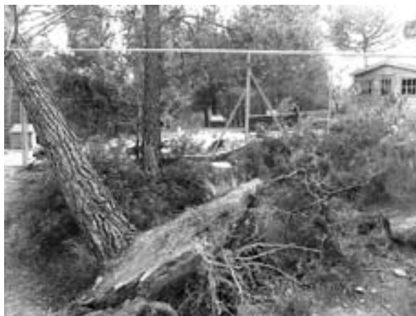
De bomen in het asiel werden met wortel en al uit de grond gerukt. Het is een wonder dat er geen dieren omkwamen tijdens de storm.

In het weekend van 24 en 25 januari 2009 woedde er in Noord-Spanje een verschrikkelijke storm. U zult zich dit vast nog wel herinneren want het was overal op het nieuws. Wat de journaals niet haalde, was dat het dierenasiel in Odena bij Barcelona voor een groot deel werd weggeblazen. Veel hokken en kennels werden verwoest en een aantal dieren sloeg in paniek op de vlucht.