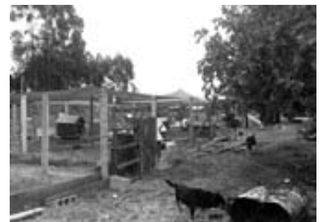
De rennen worden overdekt met zeildoek zodat de dieren droog zitten.