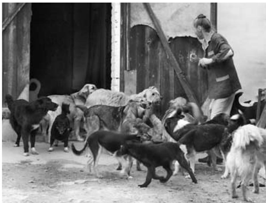
Dankzij de hulp uit Nederland zien de dieren er stukken beter uit.

Zo ben je dus een eeuwigheid bezig om contact te zoeken en zo wordt het contact je in de schoot geworpen! Maar belangrijker was wat de moeder later vertelde: "De laatste tijd is goed te zien dat er meer eten is, want de dieren zien er stukken beter uit. Je kunt echt merken dat het geld uit Nederland helpt." Zo hoort u uit eerste hand wat uw bijdragen voor de dieren in Kiev betekenen en hoe belangrijk ze zijn. Dank u wel.